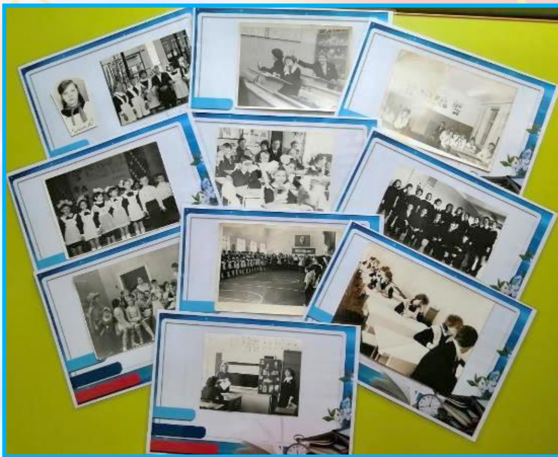
Фотоальбомы «Мы тоже были школьниками», «Школьная пора... Как было, как сейчас...»