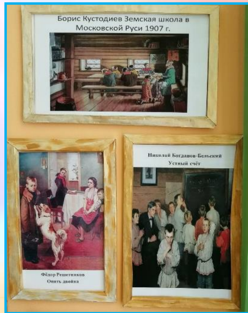
Иллюстрации портретов художников о школьной жизни на Руси.