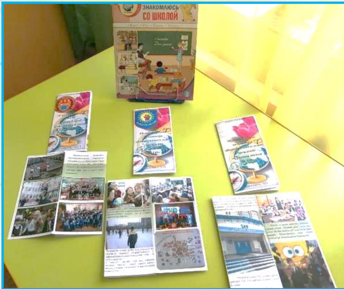
Информационные буклеты о школах округа Взлетка.