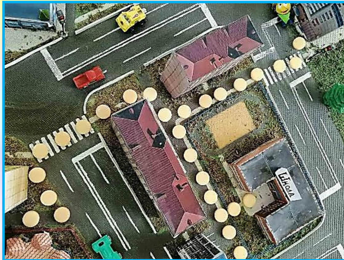
Карта – путеводитель : «Дом-школа-дом»